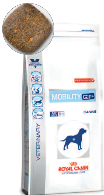
Sack: 2 kg, 7 kg und 12 kg