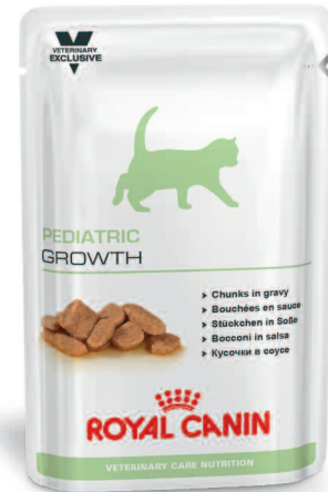
Frischebeutel: 100 g