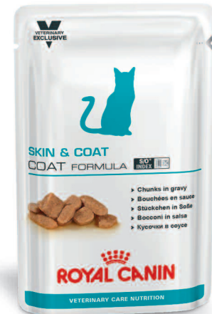
Frischebeutel: 100 g