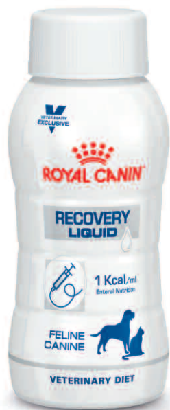
Flüssig: 3 x 200 ml