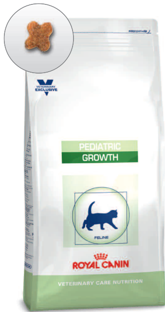
Sack: 400 g, 2 kg und 4 kg